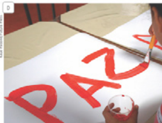
Criança pintando cartaz.