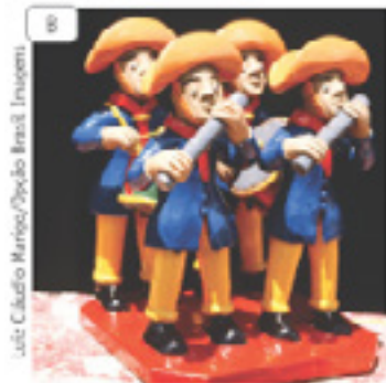
Artesanato de barro, Recife (PE).