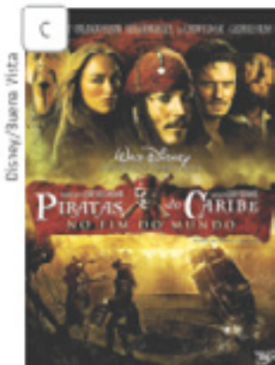
Capa do DVD Piratas do Caribe – No fim do mundo, de Gore Verbinski, Estados Unidos, 2007.