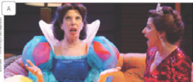
Peça de teatro Vanya e Sonia e Masha e Spike, no Teatro Faap, em São Paulo (SP), 2013.