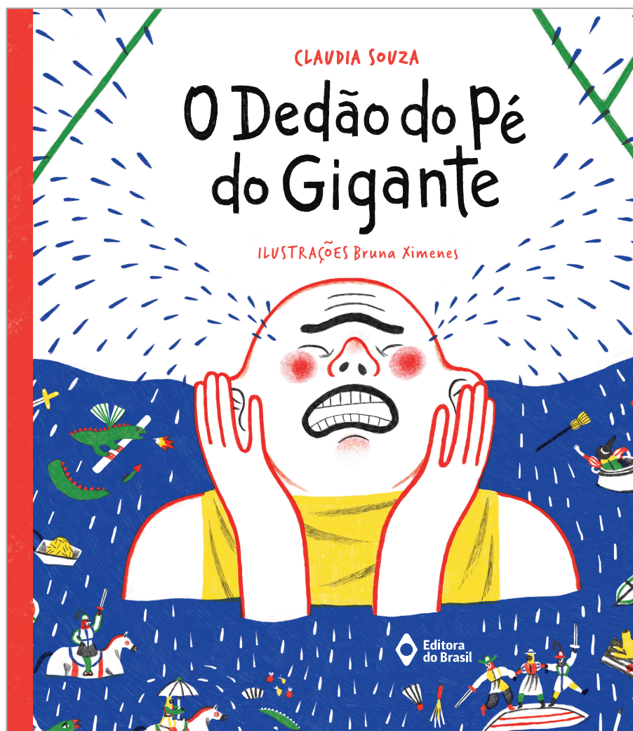
Claudia Souza Ilustrações de Bruna Ximenes